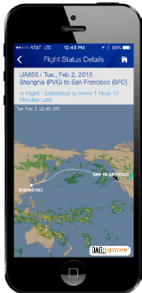
美国联合航空空中追踪地图